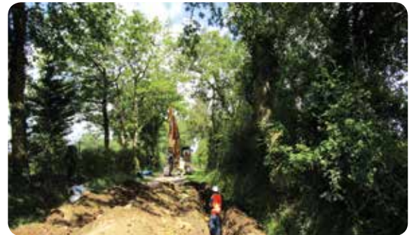
Chemin des Diligences, ouverture d'une tranchée pour pose de canalisation

NB : à ces travaux s'ajoute le passage de la fibre optique dans certaines rues qui se traduit par la présence de véhicules sur les bas côtés à proximité des chambres de tirage.