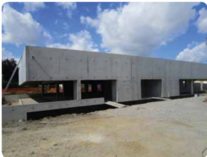
Le gros œuvre de la médiathèque est maintenant terminé

Les travaux de construction se poursuivent et la mise hors d'eau et hors d'air sera effective à la fin du mois.