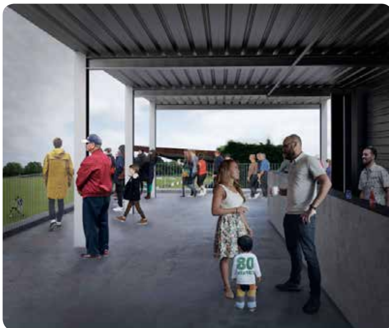
Au R+1, bar avec perspective sur le terrain d'honneur