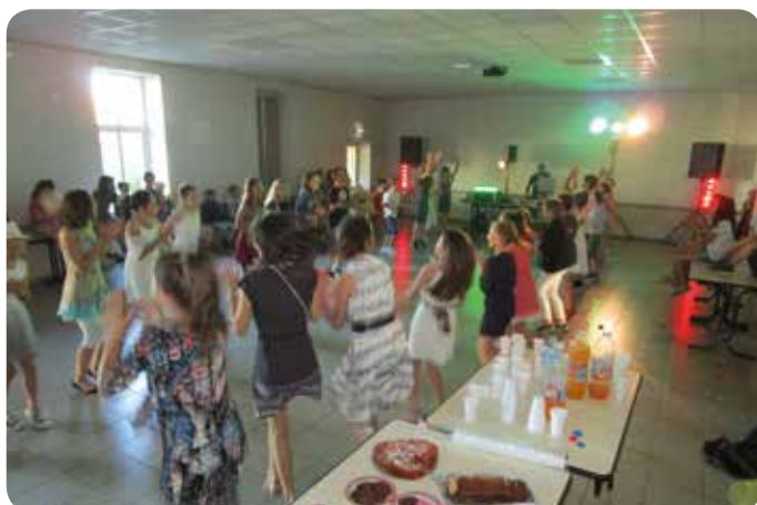
Les enfants se déhanchent sur la piste !

Le Conseil Municipal des enfants de Cugand espère que ce don pourra contribuer à réaliser un projet en cours important et serait reconnaissant s'il pouvait être informé de ce à quoi il a ainsi pu participer.