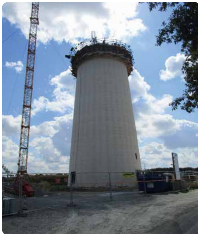
Construction du château d'eau route de Montaigu à la Bernardière

Mise en service de l'ensemble des ouvrages et des réseaux : printemps 2019.