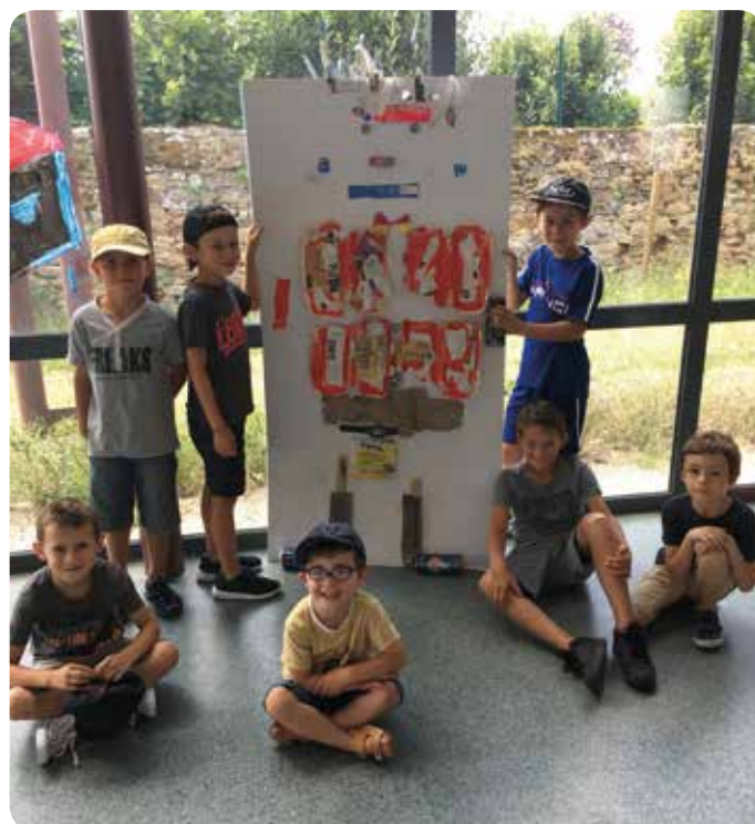
Fabrication d'un personnage avec des objets recyclés

Mardi 10 juillet, les enfants du centre de loisirs se sont promenés dans les rues de Cugand afin de ramasser les déchets laissés sur la commune. Ils ont ensuite réalisé le vendredi des œuvres pour sensibiliser à l'écologie.