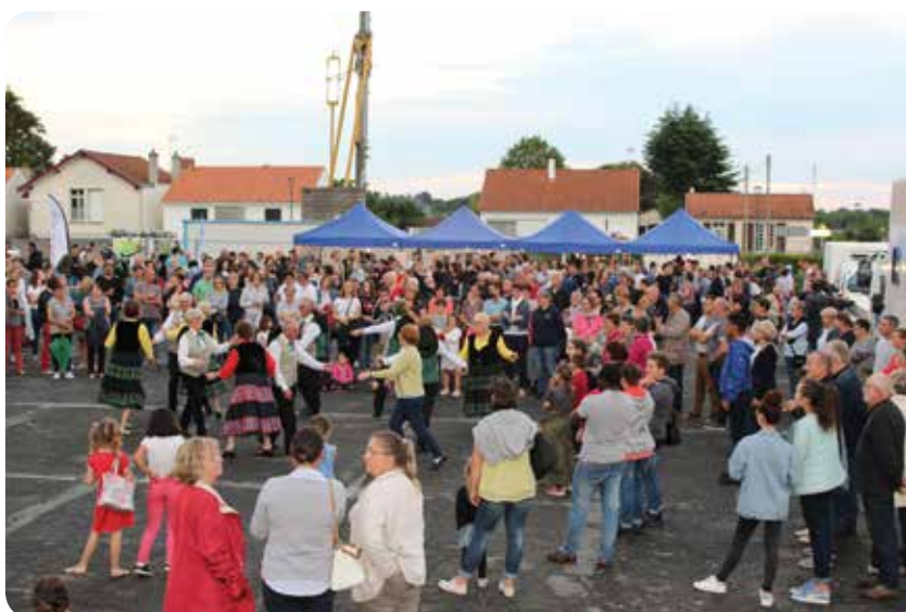
La foule rassemblée autour de la Farandole des Trois Provinces

Alors encore merci à tous et à l'année prochaine pour une cinquième édition !!!