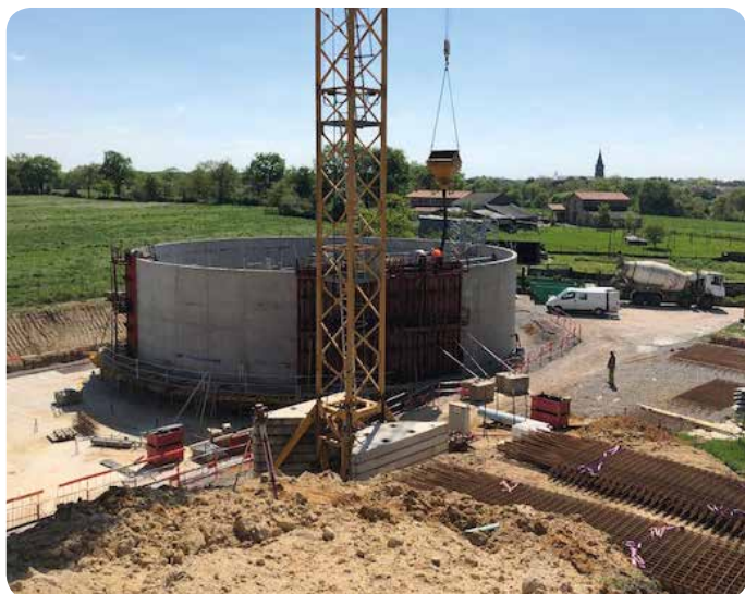
Réservoir d'eau potable en construction à la Bérangerie

L'eau stockée sera ensuite distribuée par gravité vers les communes de Treize Septiers, Saint Hilaire de Loulay, Montaigu, la Guyonnière, la Bernardière et Cugand.