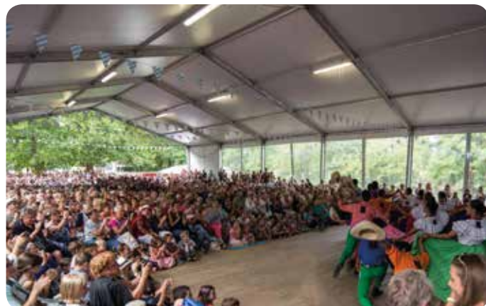
Une foule attendue pour les spectacles à venir !

Trois tours du monde et deux soirées de folie en perspective pour fêter comme il se doit nos 20 ans !