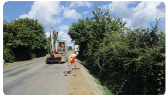
Effacement de réseaux route de Clisson

La carte ci-après récapitule ces grands travaux avec les périodes connues à ce jour, où la circulation sera perturbée. Des déviations seront alors mises en place. Merci pour votre compréhension