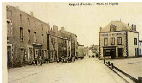
Carte postale de « Cugand autrefois »

Et bien sûr le Moulin à Foulons sera ouvert tout le weekend