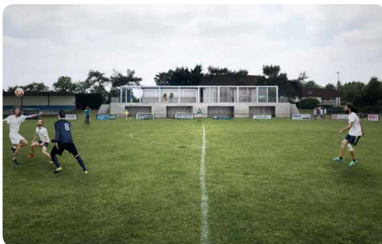
Vue d'ensemble des nouveaux locaux à partir du terrain d'honneur