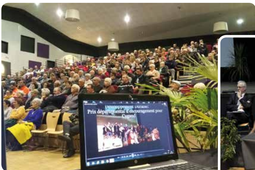
Plus de 300 personnes à la traditionnelle soirée des vœux