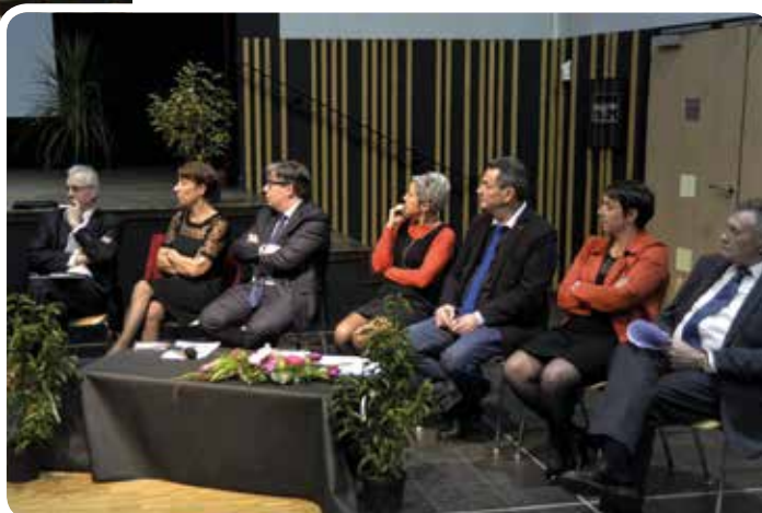
Tour à tour, les adjoints ont présenté, chacun dans son domaine, les éléments essentiels qui ont caractérisé l'année 2018

Le Conseil municipal jeunes, récemment élu, a présenté ses projets pour 2019