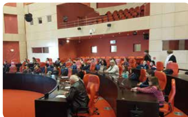
Le conseil Jeunes en révision des consignes au centre de tri

La seconde, les enfants ont visité le conseil départemental. Ils ont découvert l'histoire, le fonctionnement et ont posé de nombreuses questions dans l'hémicycle. Ils ont été très intéressés par ces deux visites.