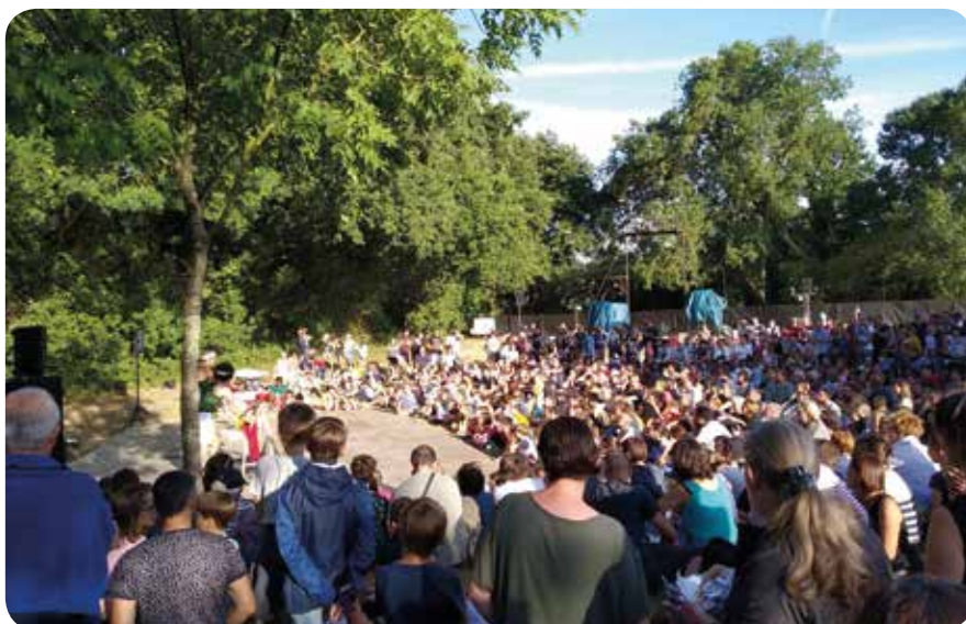
La foule présente à cette soirée a apprécié la qualité des spectacles

N'hésitez donc pas à suivre l'actualité de l'association (Facebook & Instagram) pour connaître la date de la 5ème Soirée Estivale et tous les projets qui viendront occuper l'actualité culturelle de la commune d'ici là !