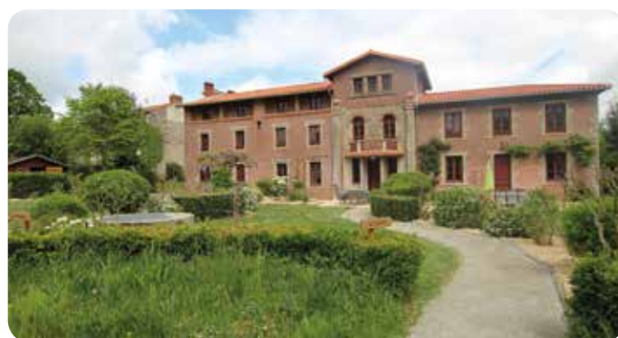
Les 3 gîtes ruraux communaux