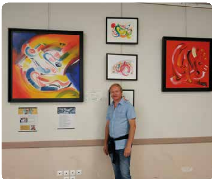
Peintures de Roland Ménoret