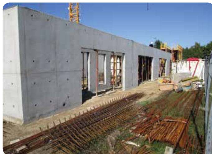
La construction respecte le calendrier et la livraison est prévue en mars 2020