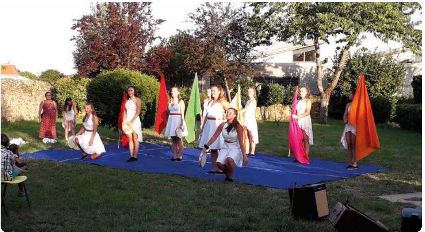
La Festi Family