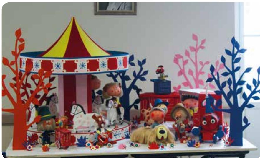
Exposition du Manège Enchanté