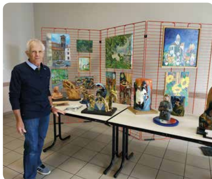
Peintures, dessins et sculptures en bois et terre peinte d'Alain Mischels