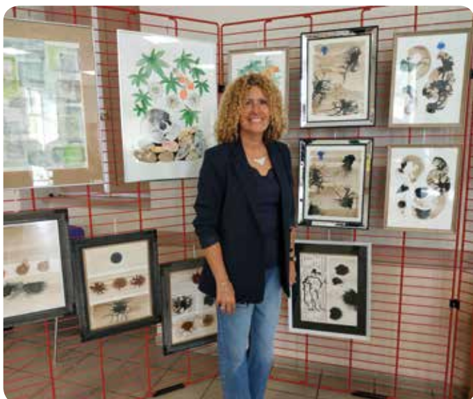
Aquarelles abstraites de Caroso