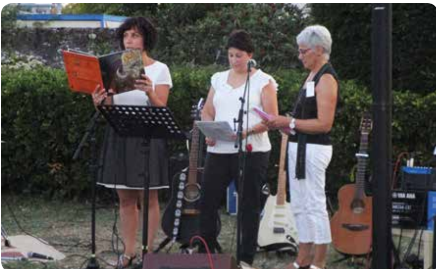
Quelques lectures d'illustration