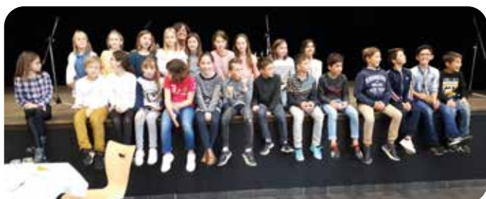
La chorale des élèves de CM2 de l'école St Michel

Près de 200 personnes se sont retrouvées pour le traditionnel repas des aînés. Moment convivial et chaleureux animé cette année par les élèves de CM2 de l'école St Michel-Jeanne d'Arc, qui ont chanté une dizaine de chansons du répertoire de Chante Mai. Une douzaine de bénévoles ont effectué la mise en place et le service de cette journée.