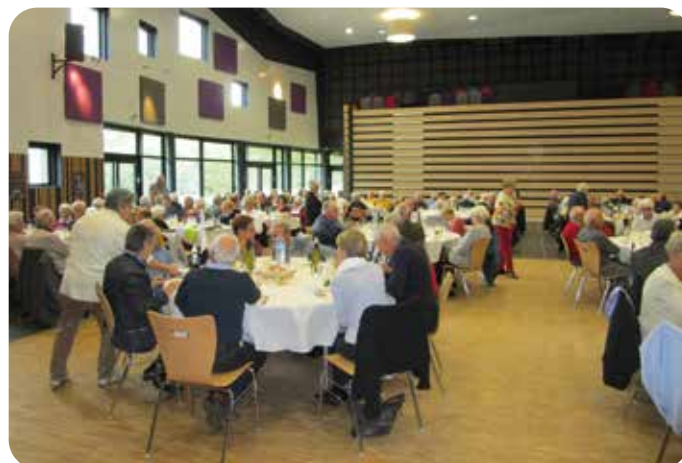
Près de 200 aînés se sont retrouvés autour du repas pour un moment de convivialité