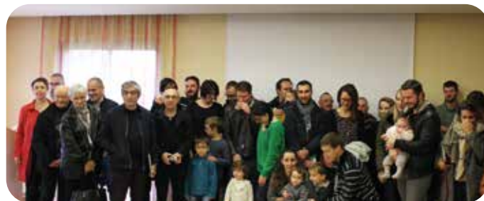
Photo de famille en fin de réunion

Une quarantaine de personnes a répondu à cette invitation, organisée par la commune. Dans une ambiance chaleureuse, les nouveaux habitants ont pu découvrir la commune avec son histoire, son évolution mais aussi sa réalité d'aujourd'hui (les services, les commerces, la vie associative, le développement économique et les projets..) son organisation et ses relations intercommunales. Un moment riche de rencontres et d'échanges autour du verre de l'amitié.