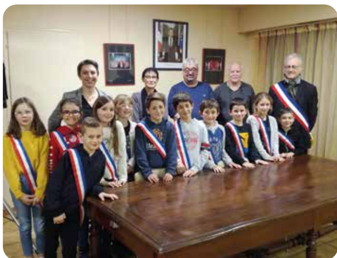
Le conseil municipal jeunes a été installé le 5 novembre

Maintenant, les six nouveaux élus avec les six anciens devront choisir les projets, courant décembre. Le choix va être difficile, les projets étant nombreux.