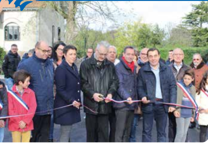
Coupure du ruban traditionnel

Participation nombreuse des riverains aux ateliers municipaux aménagés pour la circonstance en salle de réception