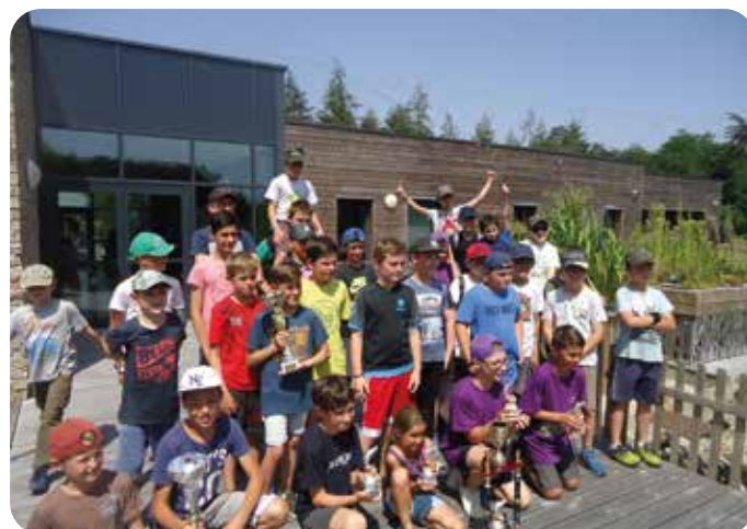
Remise du challenge des écoles de pêche à la Ferrière où l'Union des Deux Rives s'est classée 4 ème

braudjoseph@orange.fr / tél. : 0622257569