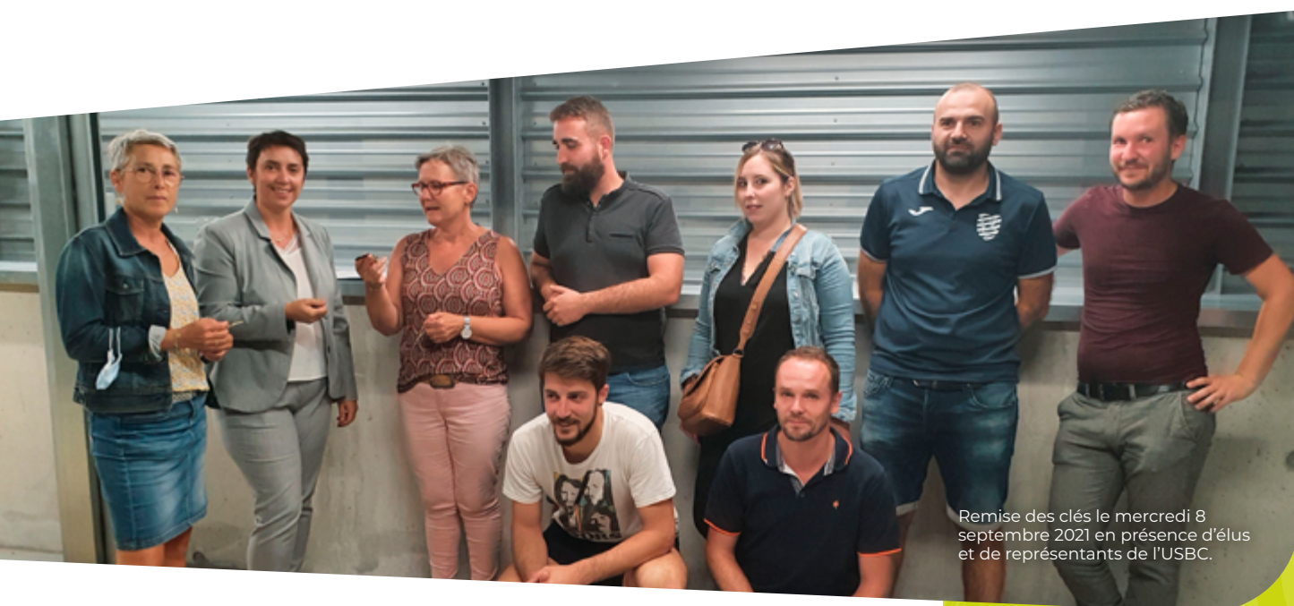
Remise des clés le mercredi 8 septembre 2021 en présence d'élus et de représentants de l'USBC.